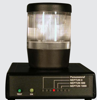
MiniVib-Empfänger Akkublitzlampe Typ 92.30