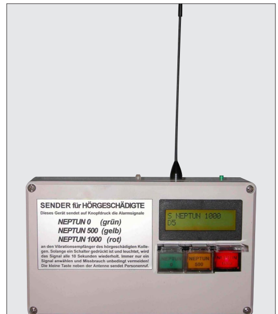
MiniVib-Sender MVTX7 Typ 91.00

Frequenzbereich: 433,100 - 434,750 MHz Empfindlichkeit: -95 dBm Stromversorgung: 12 V / 0,8 Ah Blei-Gel-Akku mit Tiefentladungsschutz - Steckerladegerät im Lieferumfang Abmessungen: 130 x 142 x 135 mm, Gewicht: 780 g