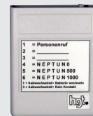
MiniVib-Empfänger MVE Typ 92.50