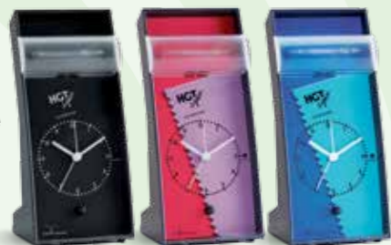
Drei verschiedene Zifferblätter